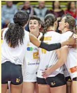
Riscatto L'abbraccio di Roma